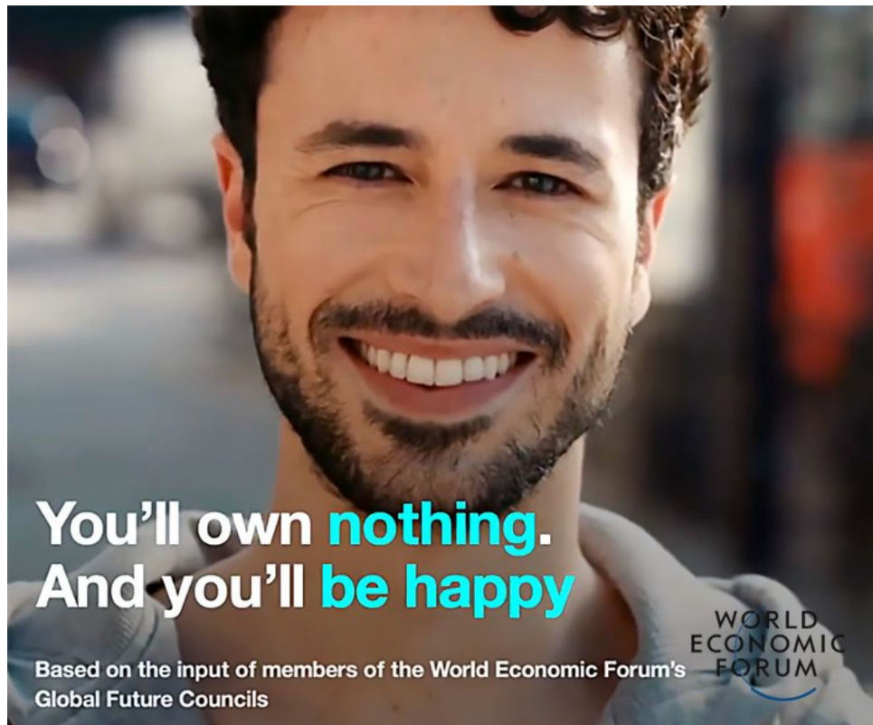
Nebudete nic vlastnit a budete šťastní – WEF

Základní Marxova myšlenka předpokládá, že výrobní prostředky budou kolektivně vlastněny, zatímco jednotlivci budou mít v osobním vlastnictví základní prostředky potřebné pro svůj život. Naproti tomu, některé současné společenské trendy naznačují, že bychom neměli vlastnit vůbec nic, což by mohlo vést k situaci, kdy se stáváme jakýmsi "bezvlastníky" žijící v cizích ohradách. Tato filozofie jde daleko za hranice Marxistického vidění světa.