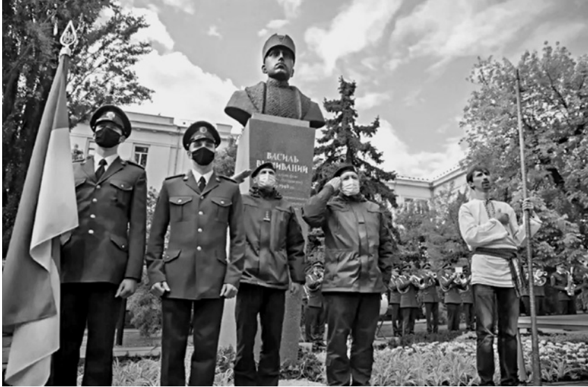
Торжественное открытие памятника Василю Вышиваному (Вильгельму Габсбургу) 20 мая 2021 г. в Киеве у станции метро «Лукьяновская».

ской армии и командиром так называемого легиона Украинских сечевых стрельцов 2 .