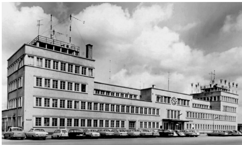
Здание бывшего аэропорта Мюнхена, в котором размещалось «Радио Свободная Европа».

биться на советский Дальний Восток, используя азбуку Морзе 1 .