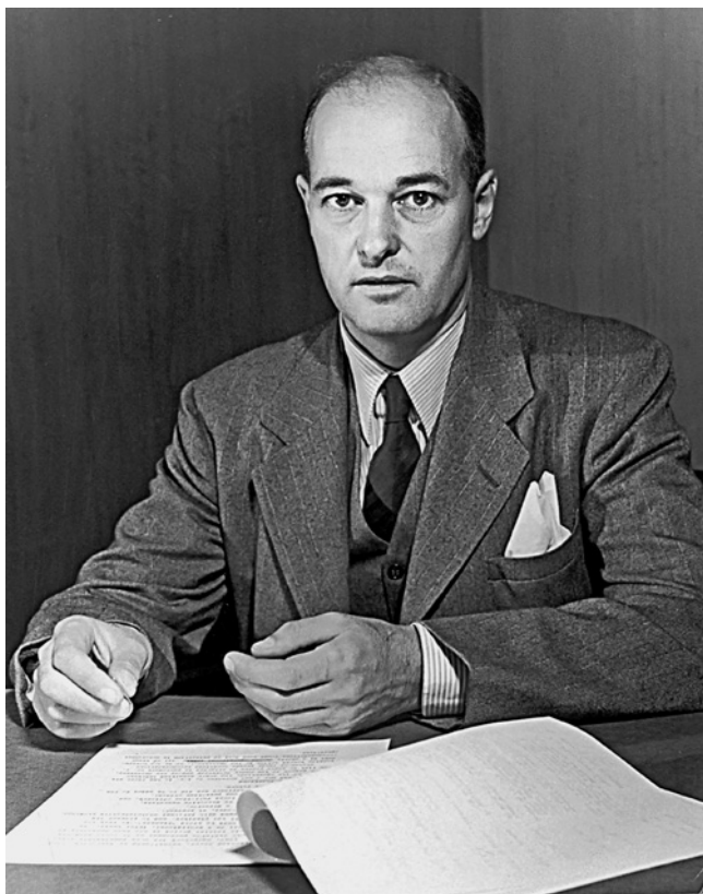
Архитектор «холодной войны» Джордж Фрост Кеннан.

30 апреля 1948 г. Фрост Кеннан подготовил для Совета нацбезопасности США меморандум под названием «Начало организованной политической войны» (The Inauguration of Organized Political Warfare). В документе была представлена организационная схема ведения подрывной деятельности в восточноевропейских государствах и «поддержки коренных антикоммунистических элементов в находящиеся под угрозой странах свободного мира». Кеннан предлагал формировать национальные комитеты, которые будут непосред-