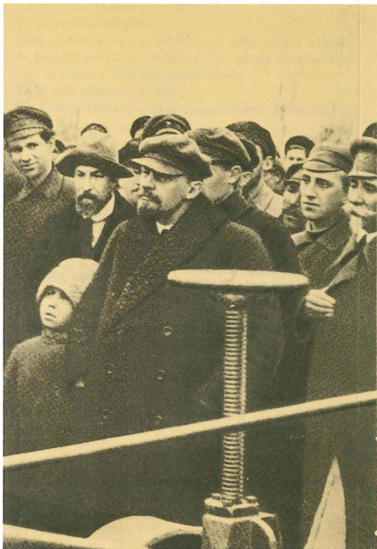
V. I. Lenin na zkoušce prvního sovětského elektrického pluhu na pokusném pozemku Moskevského zootechnického institutu 22. října 1921